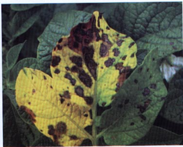
Fotografia 1. Objawy zarazy na liściach i todygach ziemniaka

W latach 2001-2004 w Zakładzie Nasiennictwa i Ochrony Ziemi w Boninie oraz w oddziale HZ Zamarte w Starym Oleśnie badano skuteczność fungicydu Pyton Consento 450 SC w ograniczaniu rozwoju alternariozy ( Alternaria ssp. ) i zarazy ziemniaka ( Phytophthora infestans ).