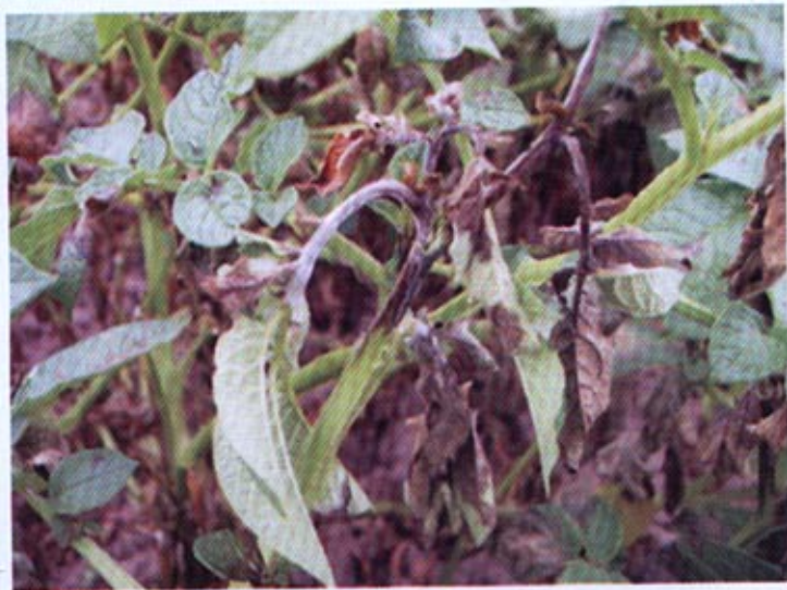
Fotografia 2. Objawy alternariozy na liściach