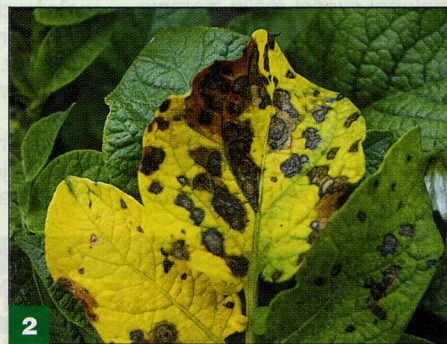
Objawy alternariozy na liściach

zestawienie w jednym produkcie dało początek fungicydom nowej generacji, tj. systemiczno-węglębnym. Pierwsza z tych substancji fenomen to substancja o działaniu węglębnym z grupy imidazolinonów, hamuje oddychanie mitochondrialne patogenu nie dopuszczając do jego rozwoju. Druga to propamokarb o działaniu systemicznym, pochodna kwasu karbaminowego ingeruje w procesy syntezy fosfolipidów i kwasów tłuszczowych patogenu, powodując niszczenie błon komórkowych i zahamowanie jego wzrostu. Połączenie tych dwóch substancji aktywnych pozwoliło na uzyskanie środka o innowacyjnym sposobie działania, który nie był do tej pory osiągnięty. Pyton Consento 450 SC to pierwszy fungicyd o sposobie działania systemiczno-węglębnym pozwalającym w pełni zabezpieczyć roślinę ziemniaka zarówno przed infekcją patogenu jak i po jego wnikięciu skutecznie hamować rozwój infekcji.