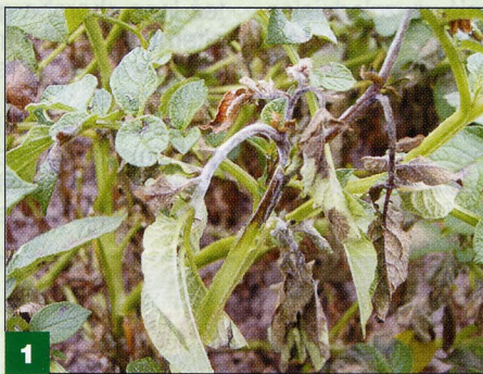
Objawy zarazy na liściach i łodygach ziemniaka

W roku 2005 do środków zarejestrowanych do zwalczania alternariozy i zarazy ziemniaka wprowadzono nowy fungicyd o nazwie Pyton Consento 450 SC. Jest to mieszanina dwóch różnych substancji aktywnych, których