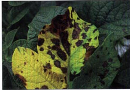
Fot. 2. Objawy alternariozy na liściach