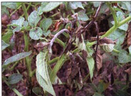
Fot. 1. Objawy zarazy na liściach i łodygach ziemniaka

Istotnym czynnikiem ograniczającym możliwość gromadzenia plonu są choroby i szkodniki występujące na roślinach i bulwach ziemniaka w okresie wegetacji i przechowywania. Do najważniejszych czynników chorobotwórczych na roślinach ziemniaka należy niewątpliwie zaraza ziemniaka (fot. 1), ale także coraz większego znaczenia nabiera inna choroba alternarioza (fot. 2). Są to dwie najważniejsze choroby, które powodując plamistości liści (niszczenie powierzchni asymilacyjnej) roślin ziemniaka, ograniczają możliwość gromadzenia plonu. Straty powodowane przez sprawców zarazy i alternariozy (wynikające z wczesnego terminu wystą-