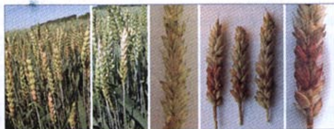
Fot. 1. Objawy fuzariozy na kłosach pszenicy